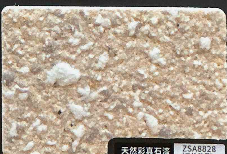
天然彩真石漆 ZSA8828 (三枪效果)