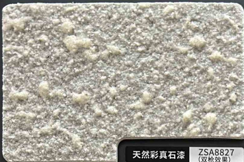
天然彩真石漆 ZSA8827 (双枪效果)